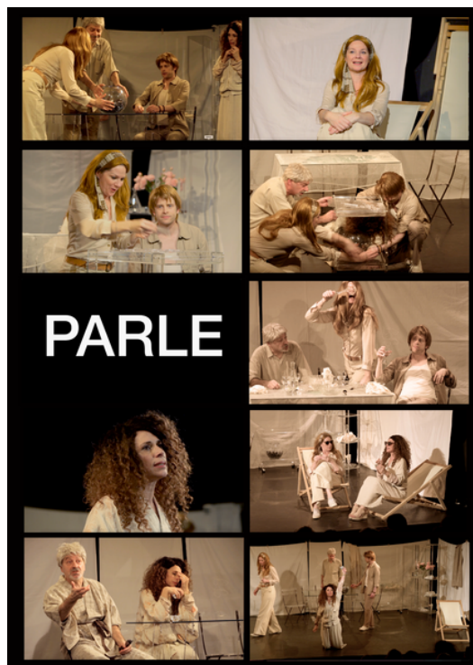
Images extraites de la captation vidéo intégrale

Les spectacles de la compagnie sont visibles sous la forme de captations vidéo et d'extraits sur le site d'ADA-Théâtre.